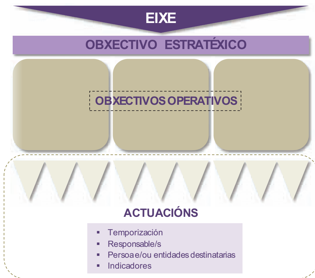
ILUSTRACIÓN 1: ELEMENTOS QUE CONFIGURAN A ESTRUCTURA DO VI PLAN GALEGO PARA A IGUALDADE ENTRE MULLERES E HOMES